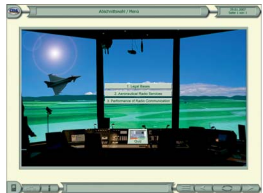
Techn. Schule der Luftwaffe Lernprogramm Flugfunkdienst