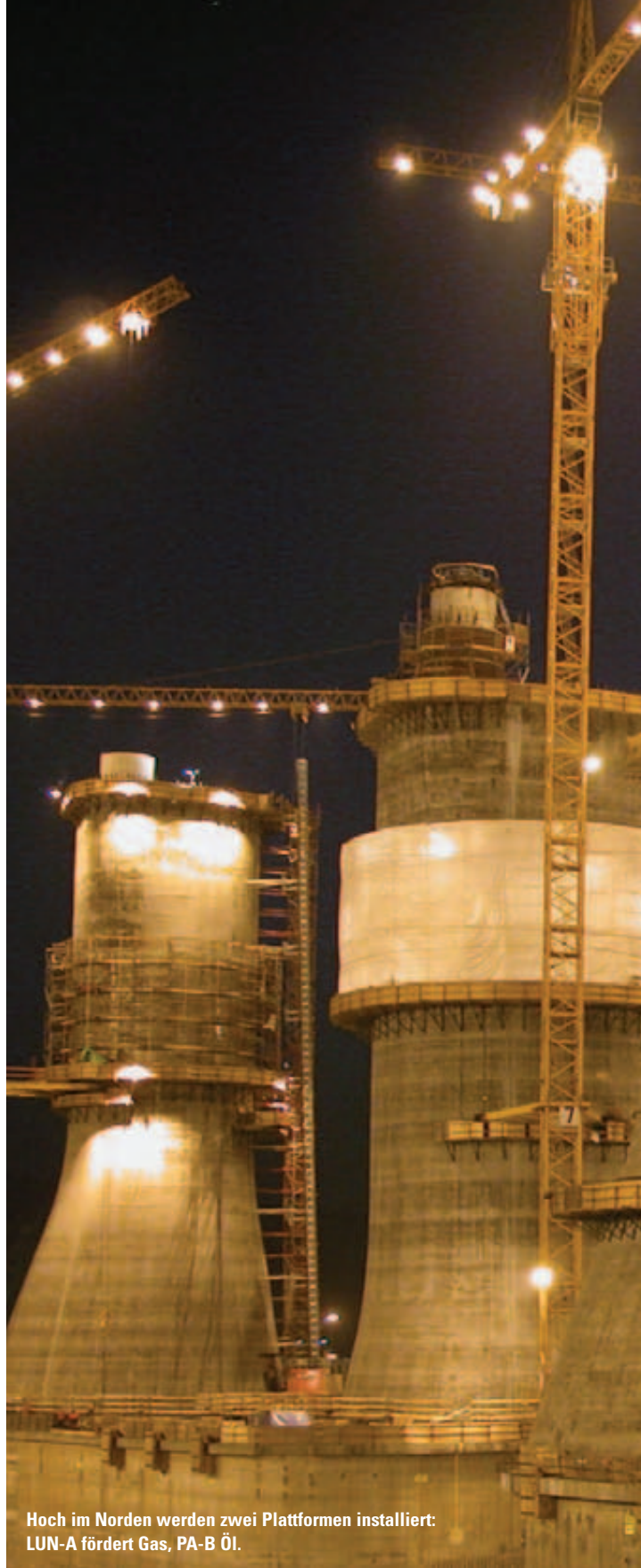
Hoch im Norden werden zwei Plattformen installiert: LUN-A fördert Gas, PA-B Öl.

Aber nun kommt es zu einer bedeutenden technologischen Innovationsperiode: Sakhalin II ist in seine Phase 2 eingetreten, mit dem Ziel, zwei an ein Pipeline-Netz angeschlossene neue Plattformen zu errichten, dank derer kontinuierlich an 365 Tagen im Jahr Öl gefördert werden kann. GLO klassifiziert diese beiden Offshore-Plattformen, unabdingbare Voraussetzung, damit SEIC eine flaggenstaatliche Registrierung verbunden mit international eindeutig definierten Eigentumsrechten seiner Anlagen erhält.