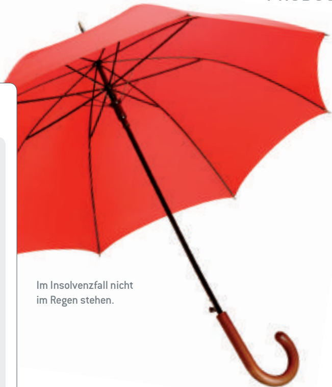
Im Insolvenzfall nicht im Regen stehen.