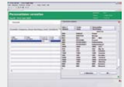
Kontextbezogenes Einblenden von Zusatzinformationen

Alle Anwendungen sind Inhouse sowie im Outsourcing verfügbar. VEDA Outsourcing bietet maßgeschneiderte Lösungen.