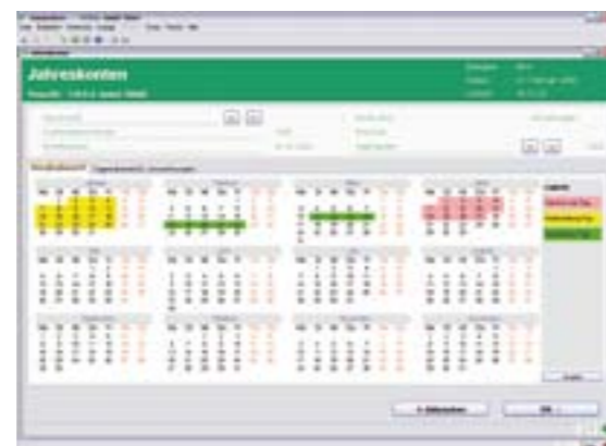
Jahreskonten im informativen Überblick