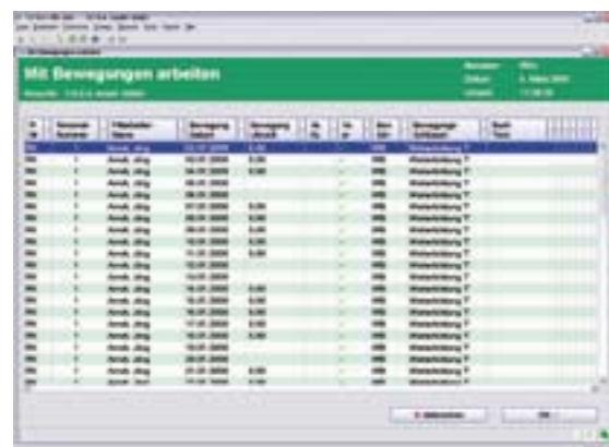
Transparente Darstellung von Bewegungen