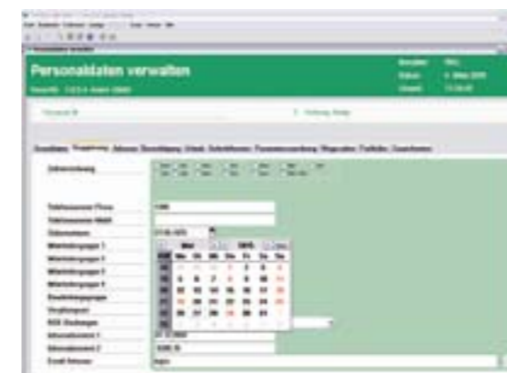
Einfache Pflege der Personaldaten