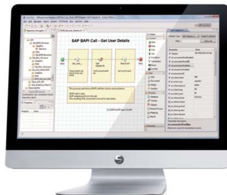
Beispiel: SAP-Integration mit dem X4 Process Designer

JCo bietet die Möglichkeit, jeden RFC/ BAPI über X4 SAP aufzurufen. IDocs zum Datenaustausch über ALE können erstellt und bidirektional mit SAP-Systemen ausgetauscht werden.