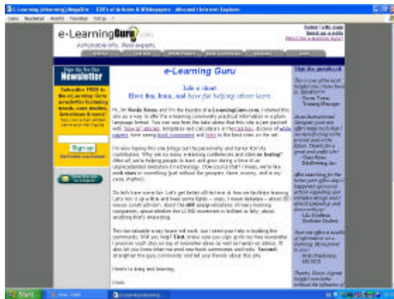
Abb.8: Homepage von e-LearningGuru.com