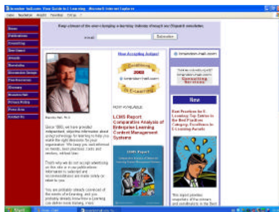
Abb.4: Homepage von brandon-hall.com

Die Website von Brandon Hall ( www.brandonhall.com ) (Abb. 4) bietet neben den genannten kommerziellen Angeboten den freien Zugriff auf eine Reihe von Artikeln, White Papers und Reports, z.B. dem 42-seitigen „E-Learning Guidebook. Six Steps to Implementing E-Learning“, das neben viel Eigenwerbung eine systematische Hilfe zur Einführung von e-Learning gibt. Ein übersichtliches Glossary und ein durchschnittlicher Newsletter runden das Web-Angebot von Brandon Hall ab.