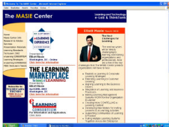
Abb.2: Homepage des MASIE Centers