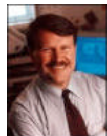
Abb.3: Brandon Hall

Brandon Hall veranstaltet darüber hinaus den „Excellence in E-Learning Award“, eine renommierte Auszeichnung von Best Practices im Bereich e-Learning. Der entsprechende Report „Best Practices for E-Learning“ (2003) kann online bestellt werden.