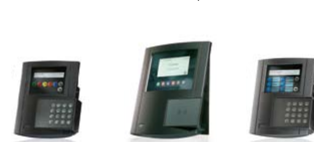
B-Net 93 20

Das Modernisierungspaket «Aus Alt mach Neu» ist zeitlich befristet und auf 1.000 Terminals beschränkt. Verlieren Sie keine Zeit. Wer zuerst kommt, mahlt zuerst!