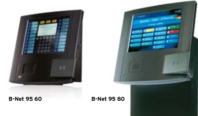
B-Net 95 60