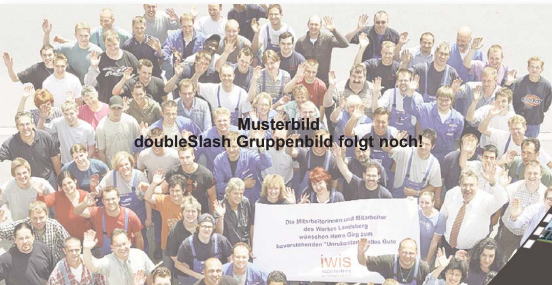
Musterbild doubleSlash Gruppenbild folgt noch!

Was unsere drei Geschäftsführer zum 10 jährigen Bestehen von doubleSlash sagen, lesen sie in unserem Interview „Hinter den Kulissen“ auf der letzten Seite dieser slashUp-Ausgabe.