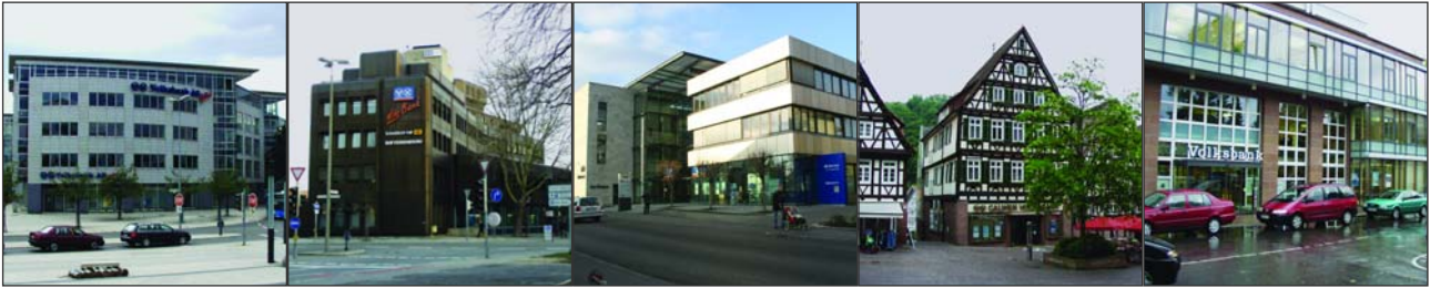
Abb. 2: Die Hauptstellen der "Vereinigten Volksbank AG Böblingen / Sindelfingen - Schönaich - Calw / Weil der Stadt"

Beispiele hierfür sind auf Gesamtbankenebene: