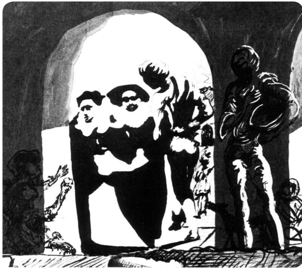
Bild: Salvador Dalí, Studie zum Sklavenmarkt; Figuren im Rundbogen oder Büste von Voltaire?

Entwicklung des semantischen Web setzt TK-Betreiber unter Druck