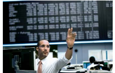
Weist der Weg an den Aktienmärkten wieder nach oben? Ein Puffer kann das Risiko mindern.

Fazit: Das Bonus-Zertifikat von BNP Paribas weist bei einer Laufzeit bis Ende September 2009 einen ordentlichen Abstand zum Sicherheitslevel von derzeit 47,0 Prozent auf. Möglich sind mit dem Zertifikat eine attraktive Bonus- beziehungsweise Seitwärtsrendite von 10,3 Prozent, aufs Jahr gerechnet.