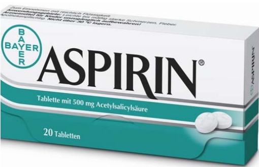
Aspirin von Bayer. Pharma-Aktien bereiteten Anlegern in Krise weniger Kopfschmerzen als zyklische Titel.

Fazit: Die Sicherheitspuffer (Bayer: 35 Prozent; Sanofi-Aventis: 33 Prozent) machen zwar auf die kurze Laufzeit einen komfortablen Eindruck. Aber Vorsicht: Verletzt ein Titel seine Barriere, richtet sich die Rückzahlung nach der Wertentwicklung der schlechtesten Aktie.