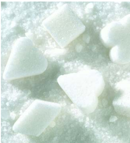
Glückszucker von Südzucker. Der Konzern sieht nach schweren Zeiten optimistischer in die Zukunft.

Das Discount-Zertifikat der Deutschen Bank auf Südzucker bietet bei einem Discount von 18 Prozent eine zuckersüße Seitwärtsrendite von 17 Prozent.