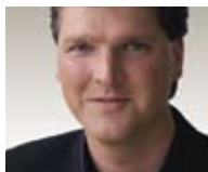
Andreas Pfeilschifter Herausgeber INDUKOM