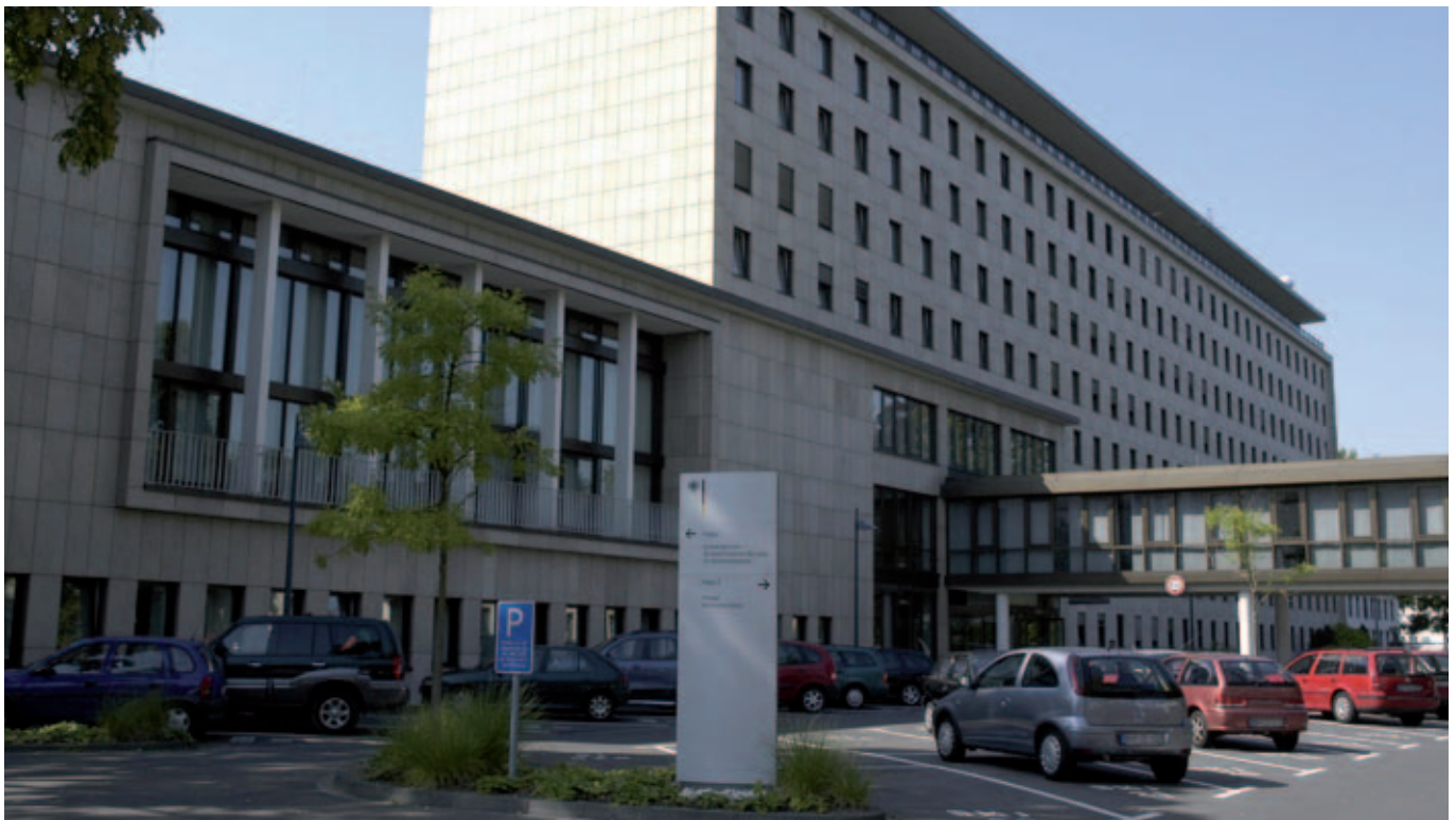
Das Bundesamt für Justiz (BfJ), Bonn, ist eine noch sehr junge Behörde, die zum 1. Januar 2007 gegründet wurde.