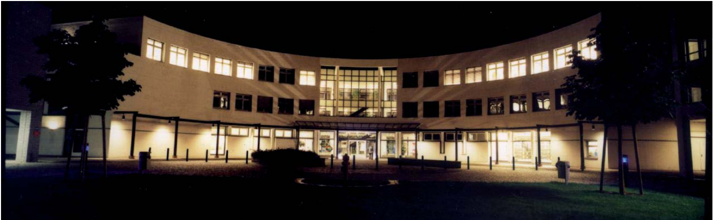
Im ZIB wachsen Storage- und Rechnerwelt zu einem homogenen Umfeld zusammen; Quelle: Konrad-Zuse-Zentrum, Berlin.