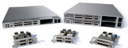
Nexus 5000, Cisco Systems

Die neuartigen Cisco Access-Switches überwinden die alte Trennung zwischen Speicher- und IP-Netzwerk. Der Nexus 5020 ist der erste 10-Gigabit-Switch, der den künftigen Industriestandard Fibre Channel over Ethernet (FCoE) für die Praxis tauglich zur Verfügung stellt. Bildlich gesprochen verpackt FCoE das Fibre Channel Protokoll aus dem SAN und die IP Protokolle aus dem LAN so, dass sie problemlos über die gleichen Ethernet-Leitungen transportiert werden können. FCoE hat weitreichende Konsequenzen für die Transformation heutiger Rechenzentren in flexible Serviceumgebungen mit stark vereinfachter I/O-Architektur. „Bei uns wird der FCoE-fähige Cisco Nexus 5020 die Notwendigkeit, zusätzliche Fibre-Channel-Adapter anzuschaffen, deutlich reduzieren. Außer der unmittelbaren Kostenersparnis bedeutet das auch eine erhöhte Skalierbarkeit des Datendurchsatzes. Denn die begrenzte Anzahl von Adapter-Steckplätzen in einem Server ist bei unseren Anforderungen wirklich ein Problem“, so Wolfgang Pyszkalski. Im ZIB erfolgen SAN- und Ethernet-Anschluss von Servern im ZIB durch den Nexus 5020 zudem erstmals über ein und dasselbe Gerät.