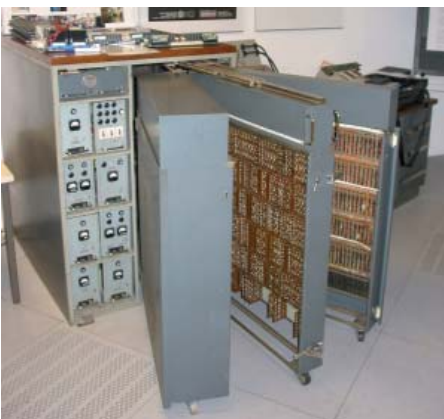
Einer der seit 1961 gebauten Z25 im ZIB-Museum.

Eine der numerischen Neuerungen von Konrad Zuse, die sogenannte Gleitkommazahl, nutzt wohl jeder von uns fast jeden Tag. Denn Gleitkommazahlen sind noch heute Basis aller gängigen Computer, vom Taschenrechner bis zum Hochleistungscomputer. Ein solcher Supercomputer steht auch in jenem Berliner Forschungsinstitut, das Konrad Zuse zum Namenspatron hat, dem Konrad-Zuse-Zentrum für Informationstechnik Berlin. Die Schwerpunkte der außeruniversitären Forschungseinrichtung liegen auf algorithmischer Mathematik und praktischer Informatik. Im Vordergrund stehen mathematische Modelle zur Beschreibung komplexer Phänomene in Naturwissenschaft, Technik, Ökonomie und Umwelt. Daneben entwickelt und testet das ZIB effiziente Algorithmen zur rechen-technischen Simulation ebendieser Modelle. Die Theorie steht im ZIB im Dienst der Lösung praktischer Probleme. Computer Science und Scientific Computing werden hier als zwei Seiten einer Medaille gesehen.