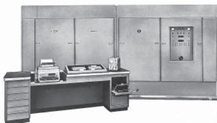
Rechenmaschine Z22 (1958): Rechner, der die Elektronische Datenverarbeitung (EDV) in die Deutschen Universitäten und Hochschulen einführte (Aussage von Prof. Giloi, TU-Berlin, 1995).

Um maximalen Ausfallschutz zu garantieren, ist jeder Server immer über separate Leitungen mit beiden Nexus 5020 verbunden. Jeder Nexus 5020 ist über zwölf 4 Gb/s FC-Ports an das Speichernetzwerk angeschlossen. Pro Switch ergibt das eine rechnerische Bandbreite von 48 Gigabit pro Sekunde. Die Brücke ins IP-Netzwerk schlagen demgegenüber 10-Gigabit-Ethernet-Leitungen, die vom Nexus zu zwei baugleichen Switches Cisco Catalyst 6509 VS-S720 führen. Die als virtueller Switch fungierenden, gleichfalls ausfallsicher konfigurierten Catalyst-Switches, dienen einerseits als Bindeglied zum IP-Backbone im ZIB und agieren andererseits als Tor zur äußeren Welt. Zum Beispiel für das deutsche Forschungsnetz X-WiN und das Berliner Wissenschaftsnetzwerk BRAIN (Berlin Research Area Information Network).