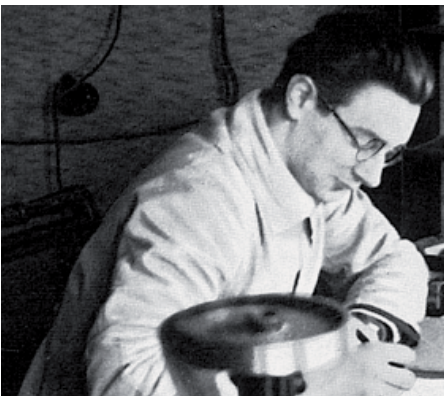
Konrad Zuse im Jahr 1936.