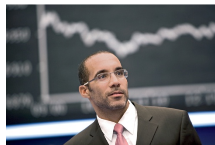
All-Time-High-Zertifikat : Kurse werden für Anleger beobachtet und Höchststände zum Teil konserviert.

Fazit: Ein Plus an Risikoschutz, jedoch nicht im stetigen Seitwärtstrend, dann können Verluste drohen. Grundsätzlich ist die Partizipation reduziert. Gewinne gibt es erst ab 122 Prozent des Startniveaus.