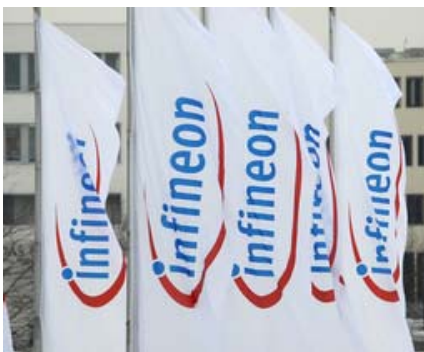
Frischer Wind bei Infineon. Der Chiphersteller will die Fertigungskapazität am Werk Dresden hochfahren.

Beschreibung: Für stattliche Kursgewinne bei der Infineon-Aktie sorgte gestern die Nachricht, wonach der Halbleiterkonzern infolge der anhaltend hohen Nachfrage nach Halbleiter- und Systemlösungen eine Ausweitung der Produktion am Standort Dresden plant. Demnach will der Chipher-