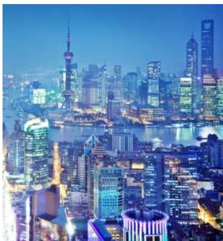
Landflucht und Wanderarbeiter: Wie Schanghai boomen viele chinesische Städte an der Küste.

Bis hierzulande eine Baugenehmigung erteilt wird, bauen die Chinesen eine ganze Stadt, übertrieben gesagt. Mit einem Zertifikat am Baurausch teilhaben.