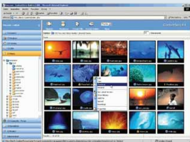
Übersichtsseite mit automatisch erstellten Thumbnails

Zentrale Bestandteile jeder Content-Präsentation sind lebendige Bilder und multimediale Beiträge. Mit dem ContentServ-Produkt CS Media steht Ihnen für die effiziente zentrale Verwaltung Ihrer Medien nun eine webbasierte Mediendatenbank zur Verfügung, auch als zentrale Media Asset-Lösung für mehrere Produkte (multimandantenfähig). Angefangen von Bildern und Flash-Animationen über Video- und Audio-Clips bis hin zur vollständigen Integration Ihrer Office-Dokumente. Selbst umfangreiche CAD-Zeichnungen und Design-Dokumente wie beispielsweise aus Adobe InDesign® oder QuarkXPress® können in der Administrations-Oberfläche verwaltet werden. Zahlreiche Bildbearbeitungsmöglichkeiten stehen Ihnen direkt in Ihrem Browser zur Verfügung. Eine Installation von Zusatz-Software ist nicht nötig.