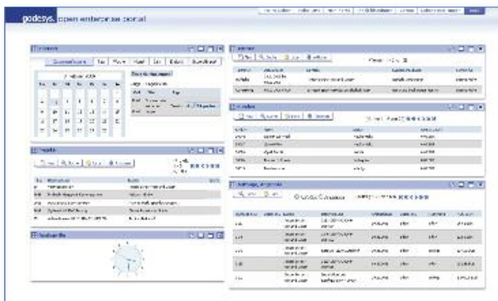
Portalansicht konfigurierbare CRM-Sicht für einen Außendienstmitarbeiter

tionsaufwendungen nicht, da nur standardisierte CRM-Prozesse wie Leadverfolgung oder Terminerfassungen dezentral zur Verfügung gestellt werden müssen. Hier schliessen die neuen CRM-Portlets eine funktionale Lücke. Jeder Inhouse-Anwender kann nun zeitgleich auch über das Portal eine mobile Online-Arbeitsumgebung zur Verfügung gestellt bekommen. Gleichzeitig bieten sich über das Rollenkonzept neue Möglichkeiten zur Einbindung von Vertriebspartnern.