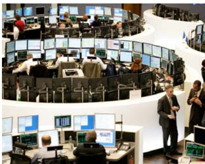
An der Frankfurter Wertpapierbörse hat sich die Stimmung seit März wieder aufgehellt.

Fazit: Attraktives Produkt für Börsenoptimisten. Das Risiko: Wird die 125-Prozent-Marke am Laufzeitende nicht genommen, richtet sich die Rückzahlung nach der Performance des Euro Stoxx 50. Hat dieser zum Beispiel 30 Prozent verloren, wäre ein entsprechender Verlust beim Zertifikat die Folge.