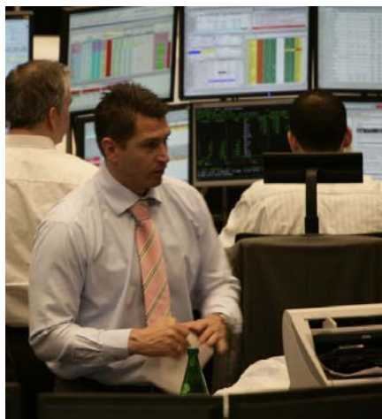
Trendwende? Die Nachfrage nach Rohstoffen zog jüngst an den Handelsplätzen wieder an.

Mit der Rohstoff Income Plus „Spezial 3“ Anleihe kann von der Entwicklung eines Rohstoffkorbs mit 100 Prozent Kapitalschutz profitiert werden.