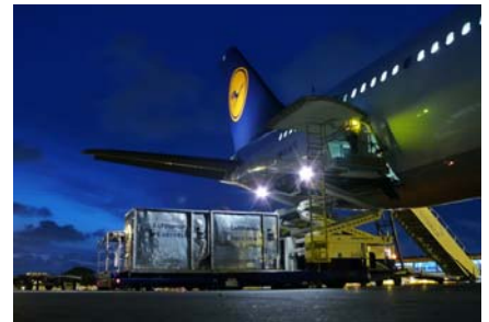
Kurzarbeit bei der Lufthansa-Tochter Lufthansa Cargo. Frachtzahlen um ein Viertel eingebrochen.

Fazit: Beim UBS-Discounter darf die Lufthansa-Aktie um rund 26 Prozent absacken, bevor es Verluste gibt. Im Seitwärtstrend beträgt die Rendite 12,4 Prozent aufs Jahr gerechnet.