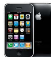
Mit dem iPhone hat Apple einen Verkaufsschlag im Sortiment. In Kürze sollen neue Modelle auf den Markt kommen.

Fazit: Das Produkt bietet einen Rabatt von 26,2 Prozent. In diesem Ausmaß ist das Zertifikat von Verlusten des Basiswerts geschützt. Die Chance: Notiert Apple am Laufzeitende im Juni 2010 über dem Cap von 120 Dollar (aktueller Kurs: 144 Dollar), wird das Zertifikat mit einer (maximalen) Laufzeitrendite von 13,5 Prozent zurückgezahlt.